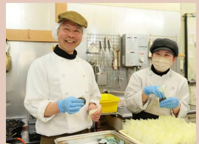
元マジシャンの店主。鉱物収集、火の見櫓探索...と多趣味な一面はユニークなお菓子作りに活かされている