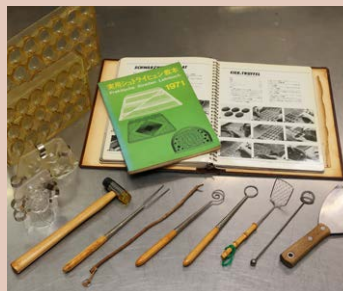
現在も活躍中という先代から引き継いだ調理本や道具