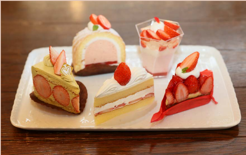
中央のショートケーキは先代から続く味のひとつ