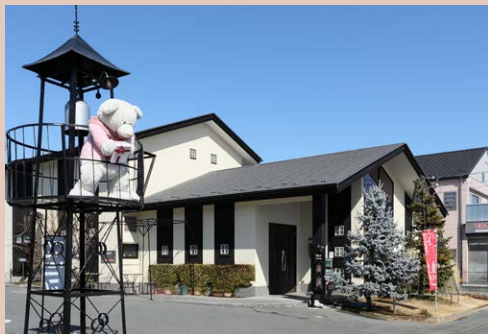
店前の火の見櫓のくまのぬいぐるみは、季節ごとに衣装替える

4月は、なんとといってもイチゴをふんだんに使ったショートケーキ。お祝いや挨拶にあわせたい、桜をモチーフにした春のギフトもおすすめです。