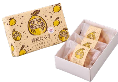
たかさき檸檬だるま/ 1個 300円(税込)、3個入り 900円(税込)

「いとをかし。」で高崎産野菜をたっぷり使ったお食事を楽しんだ後は、高崎じまんでお土産にレモンケーキを持ち帰りたい。